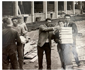
LTS Bouw Oosterwolde 1965