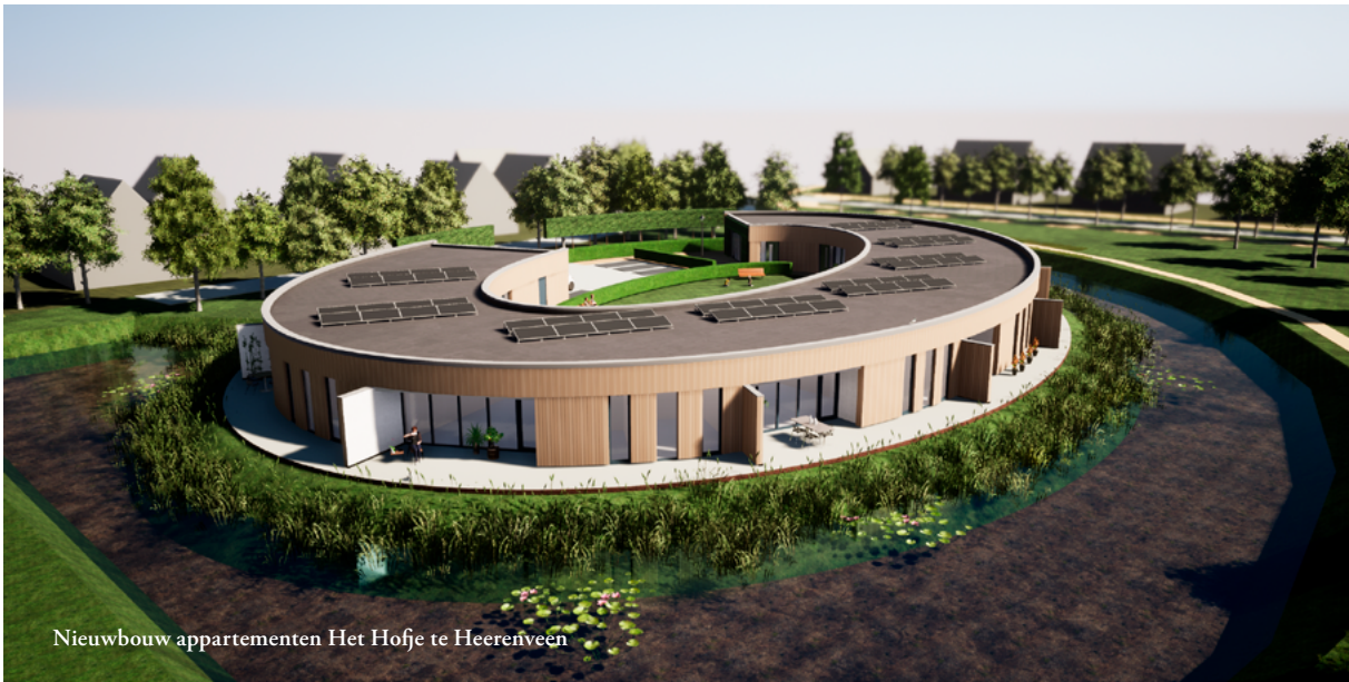
Nieuwbouw appartementen Het Hofje te Heereveen