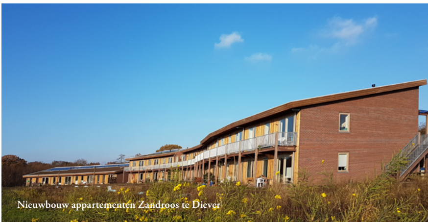
Nieuwbouw appartementen Zandroos te Diever