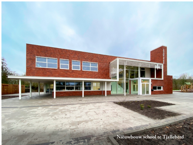
Nieuwbouw school te Tjalleberd