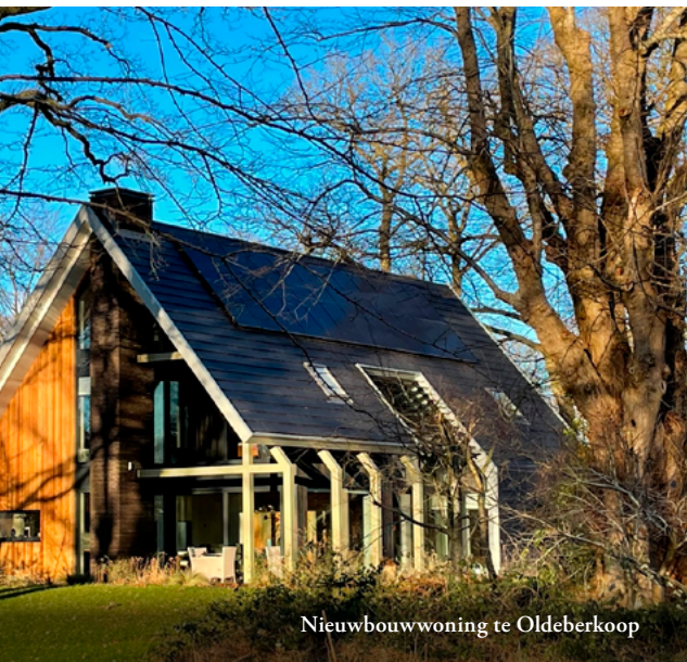
Nieuwbouwwoning te Oldeberkoop